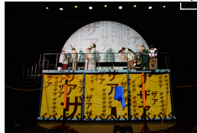
範宙遊泳「うまれてないからまだしねない」(2019)

催物の開場時・終演時などお客様の混み合う時間帯は一部ご覧いただけない箇所もございます。予めご了承ください。