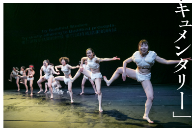
ケダゴロ「sky」

作者や演者自身が体験的に隔たれた歴史的な事件を題材とした作品づくりで注目を浴びるダンスカンパニー「ケダゴロ」。5月下旬にKAATで初演するセウォル号沈没事件を扱った新作『세월』創作プロセスの「断面」を覗き見る。思考する肉体、反応する肉体、エラーする肉体。ケダゴロにおける肉体実験の一端が明らかに!